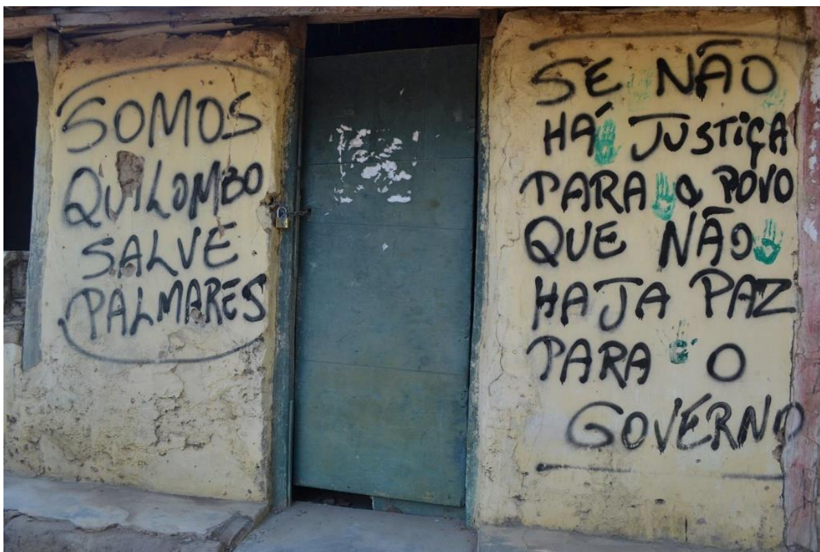
Figura 04: Estabelecimento na comunidade de Remanso, em Lençóis (BA), em 2017.