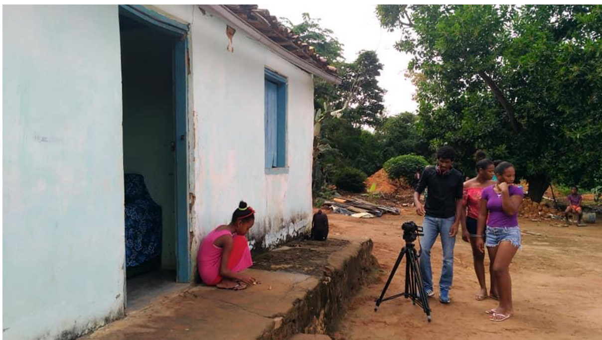
Figura 01: processo de produção da TiVi Griô em comunidades tradicionais da Chapada Diamantina.

Na conclusão, busca-se observar as relações entre as narrativas da oralidade e da linguagem audiovisual com outros elementos, com produção do conhecimento, memórias, narrativas e ecossistema comunicativo. Além disso, resgata-se algumas observações das experiências educacionais enquanto ideias processuais nas relações entre audiovisual e pedagogia e os significados da experiência em um cenário de “chuva de informações”.