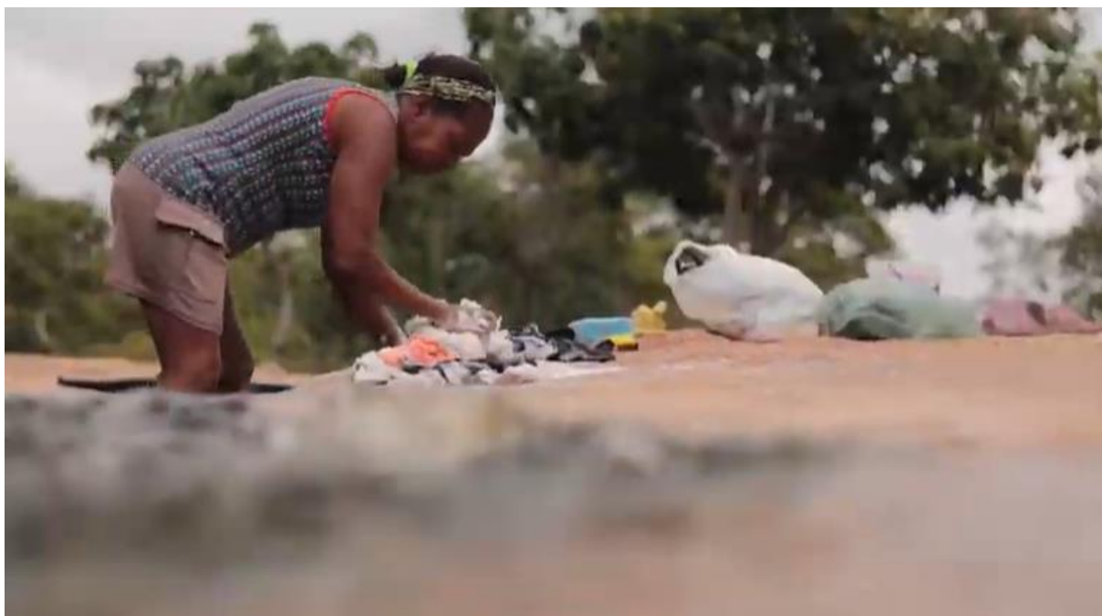
Figura 07: Vivência da Pedagogia Griô, com a construção do conhecimento a partir de conversações com a experiência em casa de farinha da comunidade do Remanso, em Lençóis (BA).

Um olhar estético da presença das lavadeiras seria capaz de afirmar uma produção de presença (Gumbrecht, 2010) que não se transmite necessariamente pelas palavras escritas, e sim pela ligação entre quem produz instantaneamente os acontecimentos que não se repetem, algo como o modo epifânico de presença que o sentido não seria capaz de transmitir no campo interpretativo. Ou seja, como presenças do evento em si que não cabem nos roteiros ou manuais.