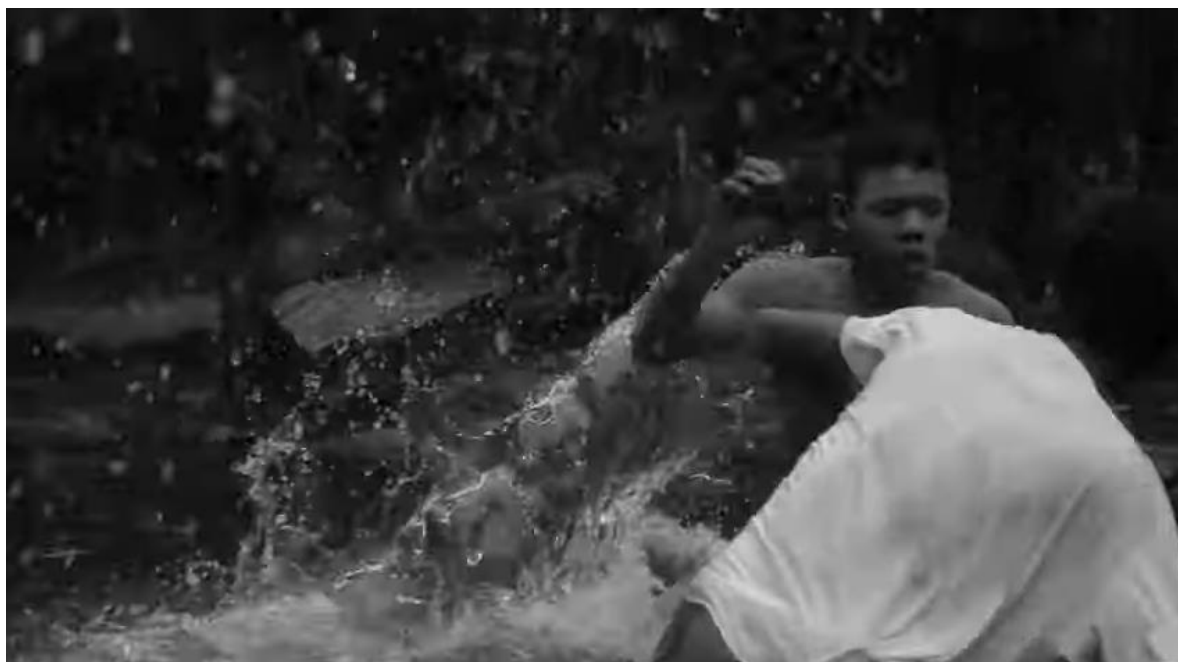
Figura 08: A juventude que toca a TiVi Griô apresenta uma releitura sobre a memória da Lenda do Pai Inácio, apresentando as lutas contra a opressão colonial e os conflitos para afirmar sua identidade ancestral. Fonte: Reprodução do filme “A lenda do Pai Inácio ou Kokumo?”, da TiVi Griô.