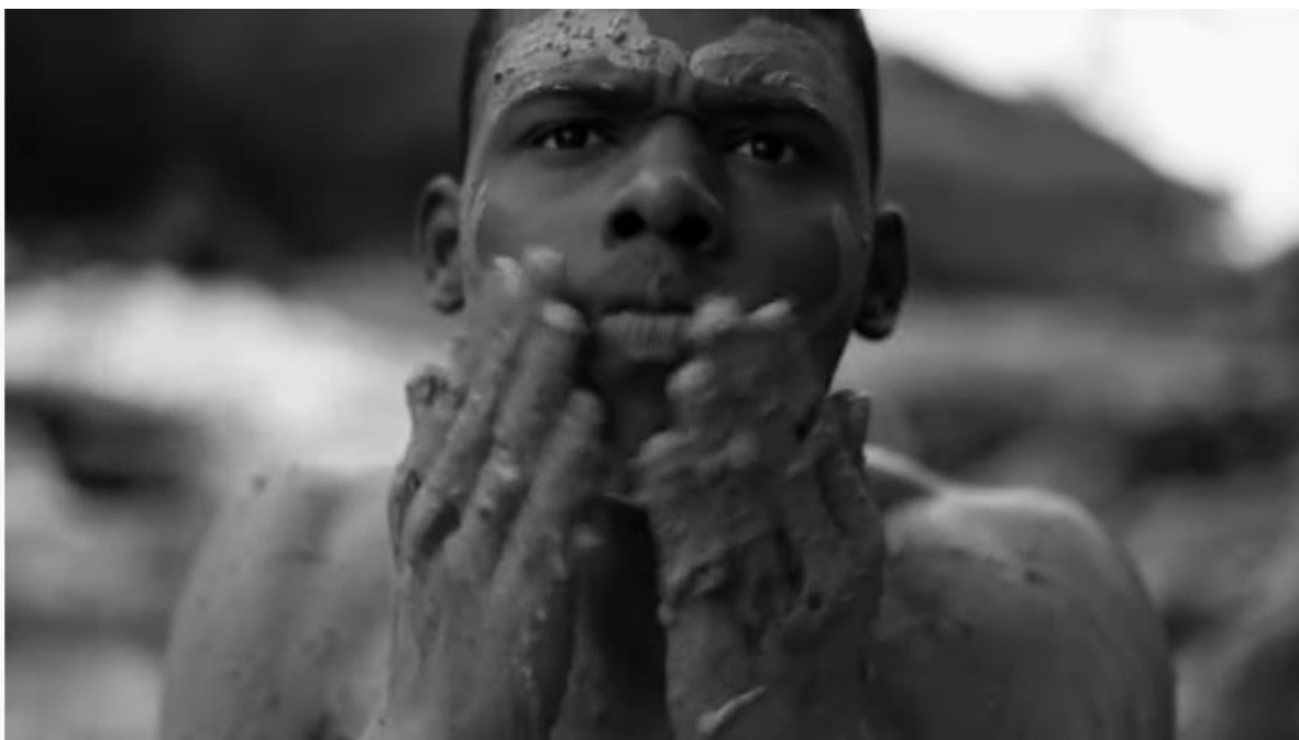
Figura 19: A transformação de Inácio em Kokumo é repleta de ritualizações.

poucos, ele vai encontrando peças vestimentas de Inácio pelas trilhas, como o chapéu e a camisa. A passagem lembra o trocar de pele de uma serpente, representando uma transformação bem mais profunda que a mudança exterior. Inácio aos poucos vai virando Kokumo, ao buscar uma liberdade diante de tantos conflitos vivenciados. Sua postura corporal muda, como uma essência cabisbaixa de “pessoa sem vida” para uma imagem altiva, como de um “guerreiro das matas”. Sua nova roupagem é a argila molhada na pele, como uma ritualização de presença com as matas, com os rios e com as pedras. Ele está também com seu guia de orixá, ao qual presta reverências silenciosas, como ecoando as mensagens de sua mãe, de “olhar para trás” quando não souber para onde ir.