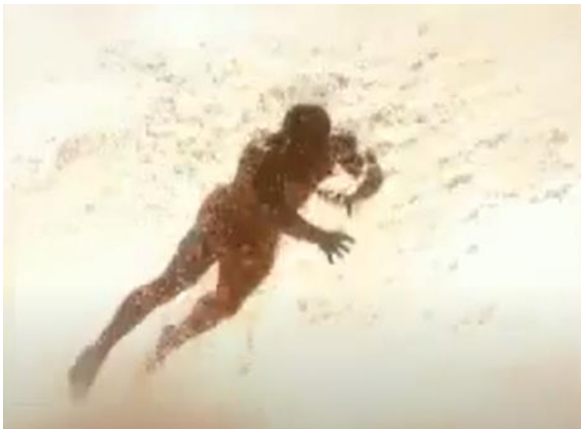
Figura 12: A representação imagética do Nego D’água, no filme homônimo da TiVi Griô, não revela diretamente uma identidade em seus traços e feições, mas de uma entidade sempre à espreita. A representação abre a possibilidade de uma construção de quem assiste de acordo com as memórias relatadas na produção e suas possibilidades de construção do conhecimento em ações pedagógicas.

presente”, de acordo com Didi-Huberman, e, por isso, são capazes de arder entre as complexas relações do tempo. Como uma chama que tanto pode ser consumida como reacendida nos muitos caminhos das temporalidades.