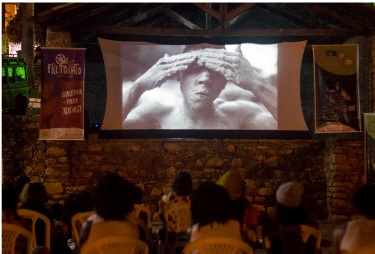
Figura 05: Exibição pública da TiVi Griô em praça de Lençóis (BA).

Reis (Reis da Cura 34 ); sabedoria na manipulação das folhas (O Poder das Folhas 35 ); histórias das comunidades contadas pelos mais velhos (Breve História de Jiquy Novo Acre 36 ); acesso ao ensino superior (Rumo à Universidade - Matrícula, bolsas e auxílios 37 ); entre outras.