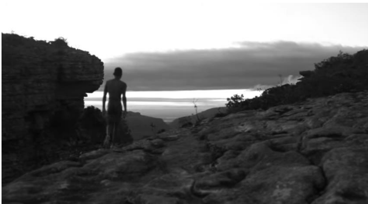
Figura 20: Ao contrário da versão da lenda em que Pai Inácio foge (ou se esconde) do barão, a história de Kokumo apresenta um final com uma entidade livre que segue pela mata. Fonte: Reprodução do filme “A lenda de Pai Inácio ou Kokumo?”, da TiVi Griô.

Kahan encontra Kokumo sentado em uma pedra, de forma serena e pede para ver o diamante negro que estava do lado dele. Neste momento, a guia de orixá já está no corpo de Kokumo. Kahan diz que a pedra poderia comprar a alforria do ex-amigo de infância, mas escuta a resposta de que já está falando com um homem livre. O feitor, no tom imperativo grita chamando “Inácio”, e novamente escuta uma correção, de quem se apresenta como Kokumo. Pela terceira vez, Kahan leva uma negativa, quando Kokumo diz que não vai atender a ordem de voltar ao seu serviço. Após as negativas, Kahan pergunta se é um desafio que está tendo pela frente. Kokumo afirma que é uma decisão. Ambos iniciam uma nova luta de capoeira. Kokumo vence e quebra a perna de Kahan, que desesperado questiona por que seu oponente não o mata. Mais uma vez o feitor escuta uma negativa, com Kokumo declarando que pretende deixá-lo voltar “para a própria” escravidão. Kokumo toma banho na cachoeira e sai pela mata representando a imagem de uma entidade construída pela ancestralidade.