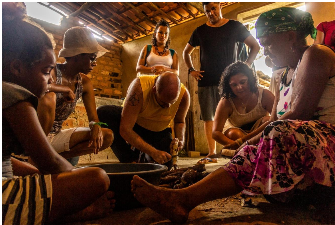
Figura 06: Vivência da Pedagogia Griô, com a construção do conhecimento a partir de conversações com a experiência em casa de farinha da comunidade do Remanso, em Lençóis (BA).

A partir de Bondía (2002) também podemos entender uma crítica que propõe um caminho inverso às imposições de poderes globais e políticas hegemônicas dentro das escolas, que desconsideram uma condição humanizada e protagonista nos processos educativos. O educador espanhol defende uma essência mais plena de necessidades internas, individuais e coletivas aos contextos das experiências. Nesse processo, deve-se ter nitidez sobre a importância de se superar uma escola que carrega uma “chuva de informações” (desconectadas da experiência e do protagonismo) por uma valorização do conhecimento, respeitando-se tempos menos acelerados e os sentidos das palavras entre ações e reflexões.