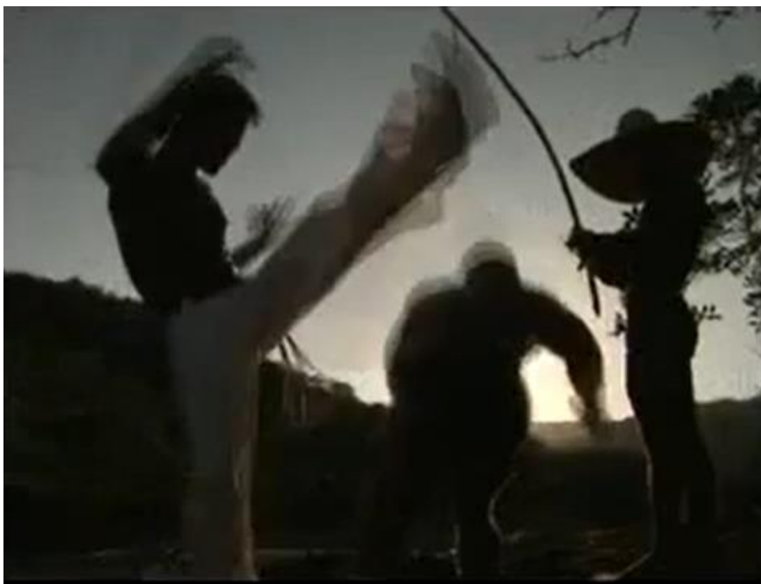
Figura 15: A capoeira entra na narrativa intergeracional do filme.

Além disso, as narrativas contadas pelo ancestral de Delvan adentram o enredo audiovisual como valorização e referência da oralidade que atravessa gerações, a exemplo do trecho em que o neto traz a memória do dom de um ente familiar que “contava uma história com um jeito de falar e de entender com as coisas invisíveis do povo do Remanso”. Ou seja, o filme destaca o dom do narrador que relata a partir de suas experiências e incorpora as coisas narradas à experiência de quem ouve essas histórias (BENJAMIN, 2012), sendo significativa para o conhecimento do neto. O destaque para “um jeito de falar e de entender” sugere justamente uma condição de excepcionalidade no contexto atual, como a própria perda do dom das narrativas apontadas por Benjamin.