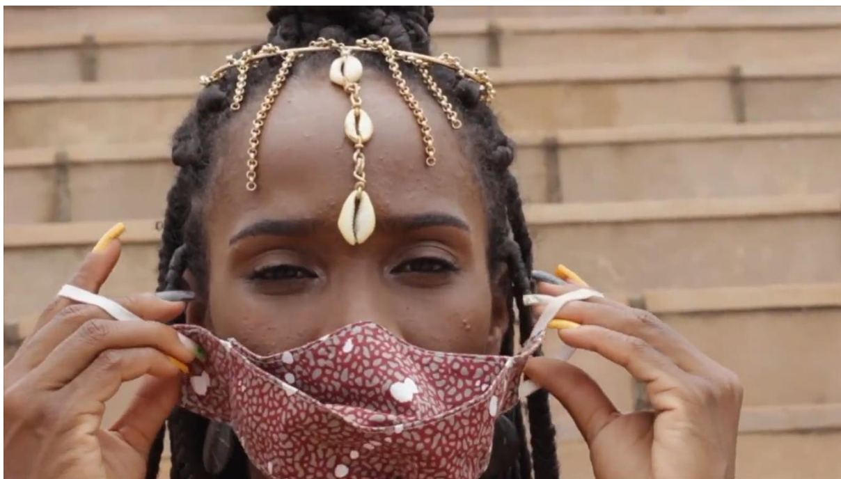
Figura 16: Os impactos da pandemia de covid-19 no momento de produção desta dissertação foi um dos temas abordados pela TiVi Griô.

de locução direta, além de mesclar cenas do cotidiano na zona urbana de Lençóis e as próprias coreografias, com danças, gestos e símbolos.