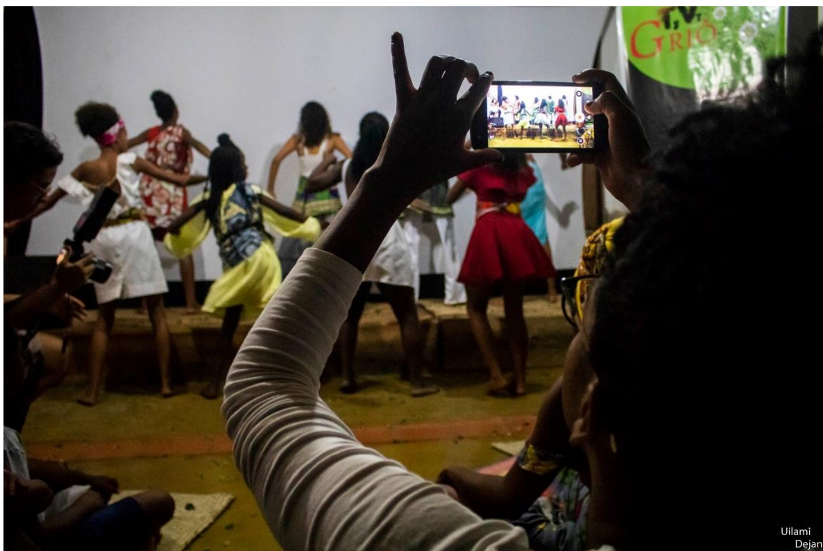
Figura 11: O ecossistema comunicativo da TiVi Griô inclui as epistemologias das tradições de oralidade em seus descentramentos e deslocamento.

educativos diante da exclusividade de aparelhos e técnicas audiovisuais. Também vale ressaltar que, ao contrário de uma perspectiva autoritária da escola como “centro sistematizador de conhecimentos” (TAVARES, MESQUITA; 2019), há um estímulo para produções que considerem o contar e recontar histórias de forma fluída e flexível através dos processos produtivos dos vídeos, nas exibições, nos cineclubes, nas interações nas redes sociais e internet, em possibilidades interdependentes da Pedagogia Griô, em que se empodera e possibilita vazão à expressão/comunicação de diversos povos, principalmente quilombolas.