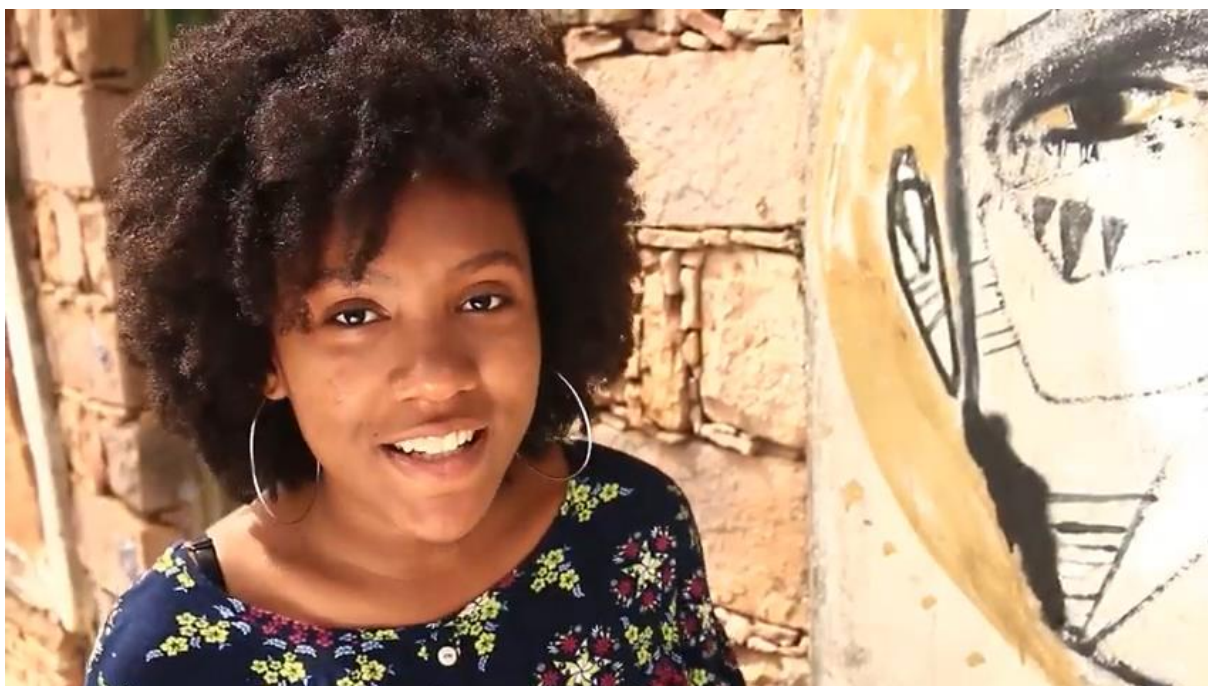
Figura 10: A TiVi Griô possui narrativas que questionam as histórias “oficiais” que reproduzem a colonialidade.

reconhecendo nossa história” 49 podemos identificar pelo menos dois elementos discursivos que remetem ao sentido de reescrever o que foi dito oficialmente nas escolas e pelas demais instituições formais. A utilização de “conhecer e reconhecer” remete uma ideia de reflexão e apropriação ao que nos é dito, ao mesmo tempo, o termo “nossa história” impõe uma condição questionamento de “outras histórias” que podem ou ser apropriadas pelas pessoas e pelos povos impactados pelos poderes coloniais.